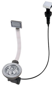
自动下水 8407 113