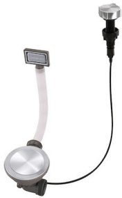
Milano 自动下水器 Space 8407 115