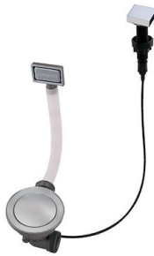
自动下水器 Space 8407 108