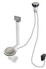
自动下水器 Space 8407 117