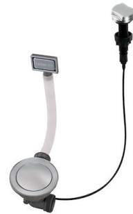
自动下水器 Space 8407 109